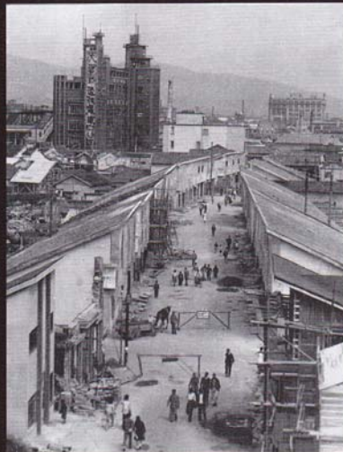
1. 神戸市生田区(現在の中央区)元町3丁目の「ジュラルミン街」(1946年10月)