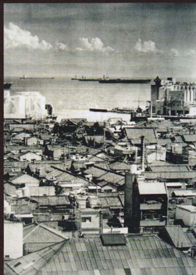
2. かつての神戸デパート(長田区)より海側を臨む(1974年)

5. 外国人向けに多言語放送をしていたコミュニティFM局「FMわいわい」の番組キューシート(震災当時) ※会場ではFMわいわいの震災当時の放送テープが試聴できます。