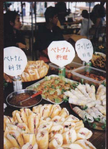
6. 長田区で開かれた「くつのみち長田アジア自由市場」の様子(1996年7月)

■協力 大木本美通/奥田英夫/米田定蔵/米田英男/エフエムわいわい/菊正宗酒造記念館/神戸市交通局/神戸市文書館/神戸新聞社/神戸大学附属図書館大学文書資料室/神戸ながたコンベンション協議会/野田北ふるさとネット/毎日新聞社/有限会社リズベクトレコード/ひとぼう未来サークル文芸・文化倶楽部KOBÉ (順不同・敬称略)