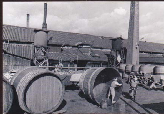
3. 東灘区の昔ながらの酒蔵(昭和30年代)