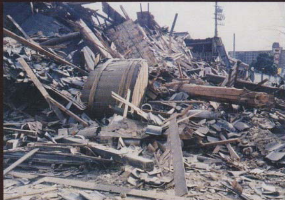
4. 震災によって倒壊した東灘区の酒蔵(1995年1月)